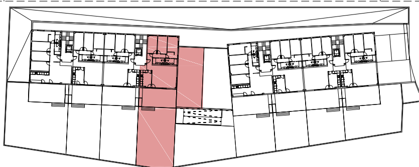
SITUACION DE LA VIVIENDA EN LA PARCELA