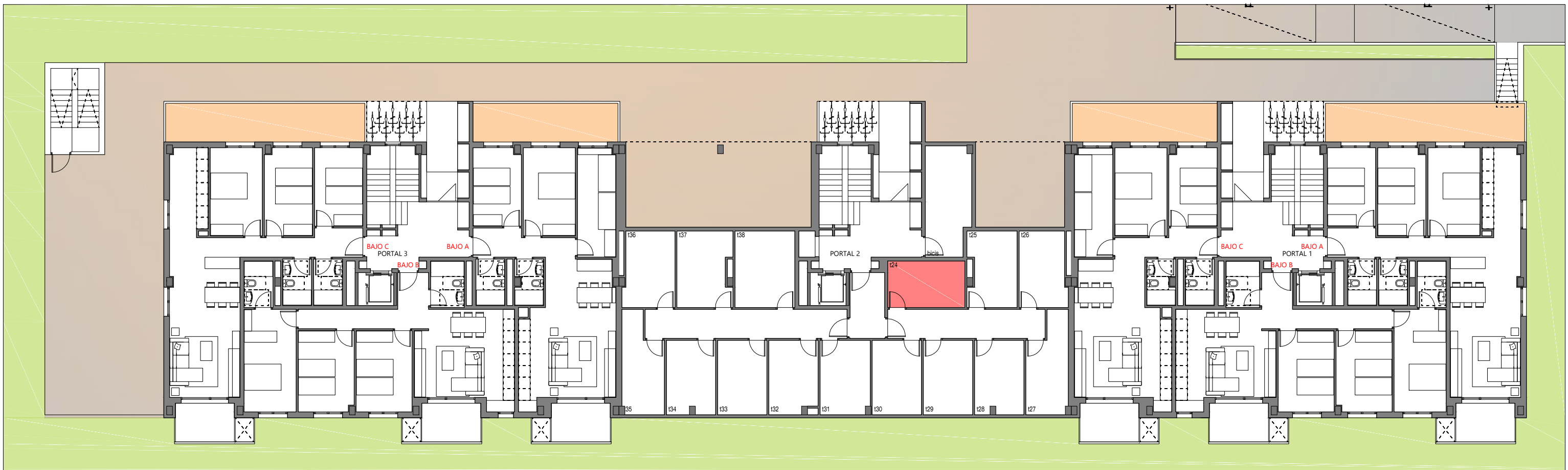
BLOQUE 1. PLANTA BAJA