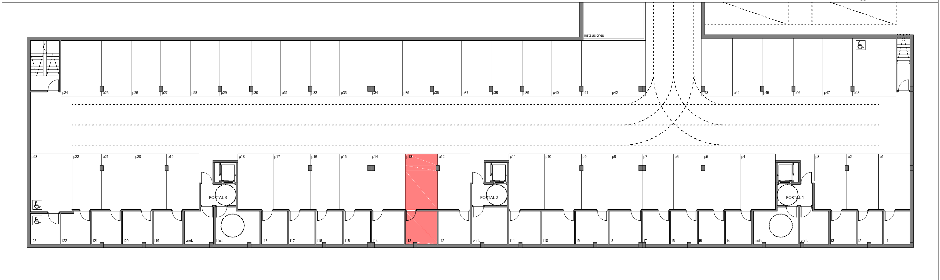
BLOQUE 1. PLANTA SOTANO